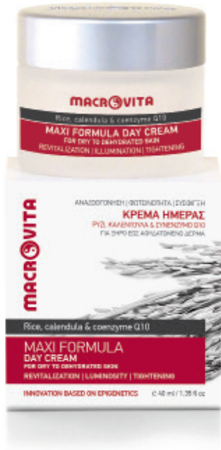
ΓΙΑ ΞΗΡΟ ΕΩΣ ΑΦΥΔΑΤΩΜΕΝΟ ΔΕΡΜΑ FOR DRY TO DEHYDRATED SKIN CODE: 31261 | e 40 ml | 1.35 fl oz